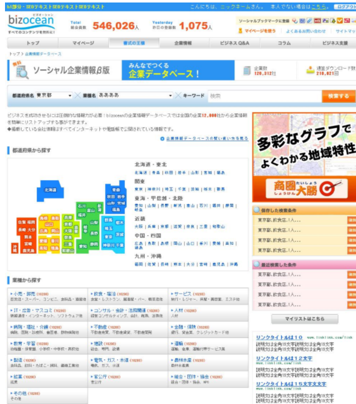
図 2: 「ソーシャル企業情報」サービス Top ページ

「ソーシャル企業情報」は、『bizocean』の新たなサイトコンセプトである「すべてのビジネスコンテンツを無料に」に応じて開始される第一弾のサービスです。『bizocean』は、従来のメインコンテンツであるビジネステンプレート約 13,000 点を無料でダウンロードできる「書式の王様」とともに、今後も同じく無料で活用できるビジネス分野のコンテンツを拡充していく予定です。