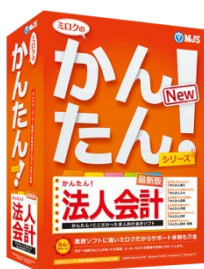
『ミロクのかんたん！法人会計』