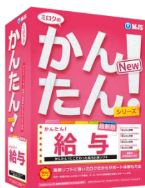
『ミロクのかんたん！給与』