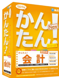
『ミロクのかんたん！会計』