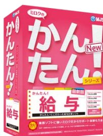
『ミロクのかんたん！給与』